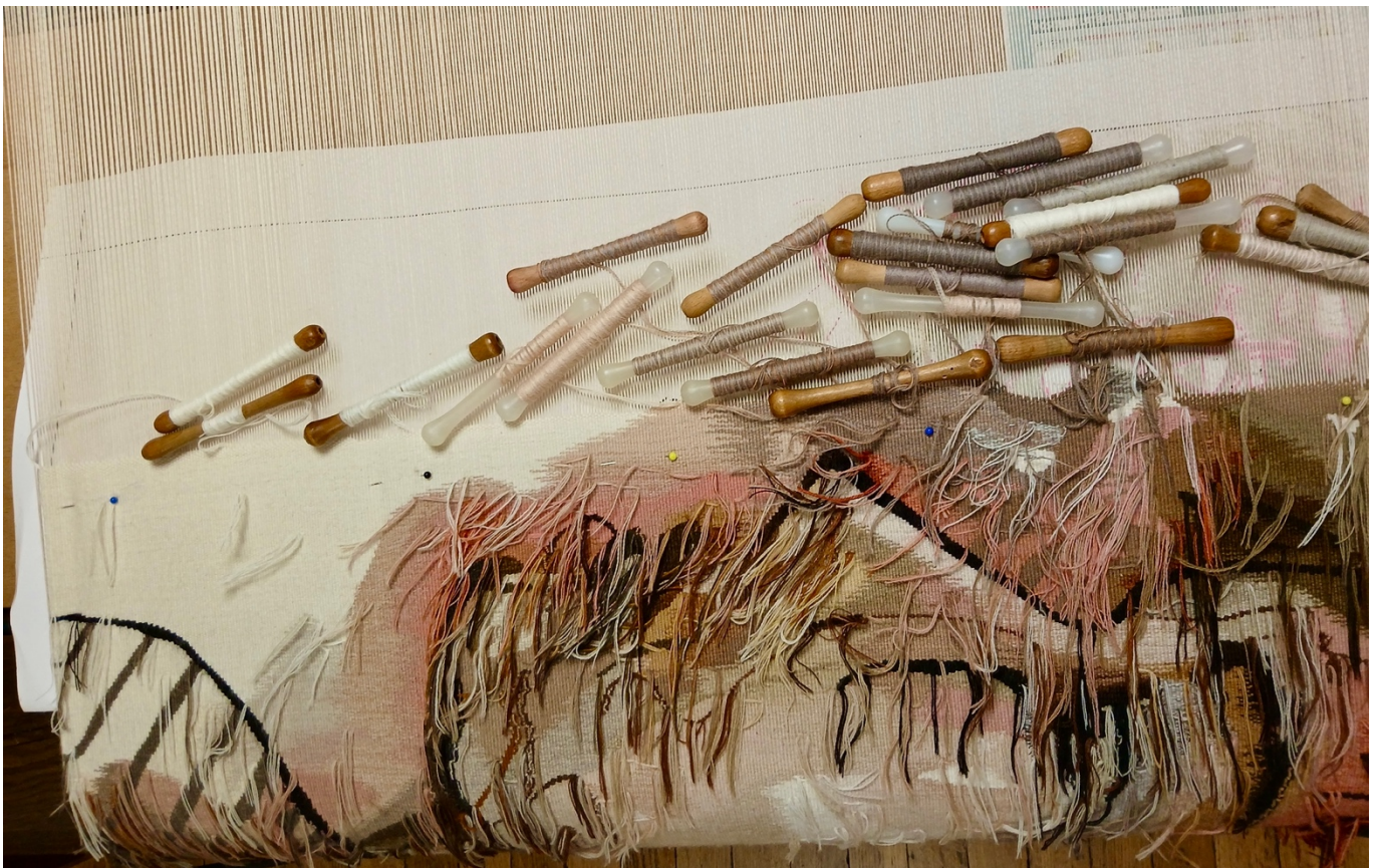
Tapiserie sur le métier