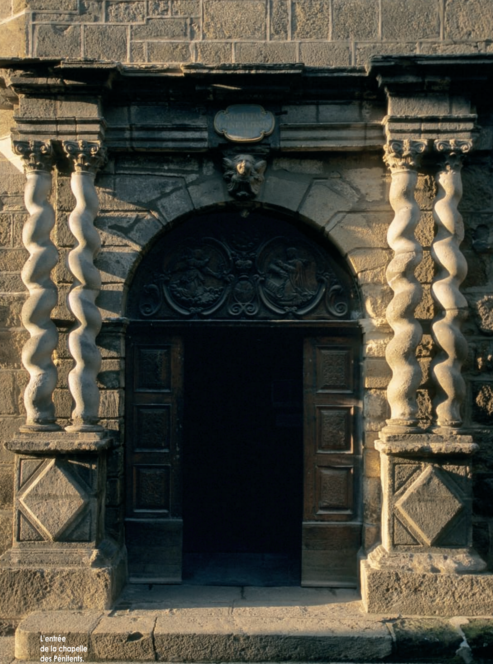
L'entrée de la chapelle des Pénitents.